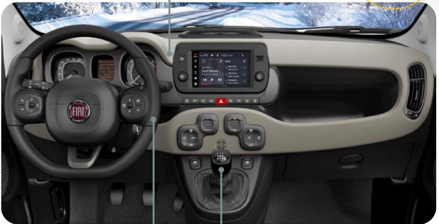
Leder-Schaltknopf mit schwarzen Nähten